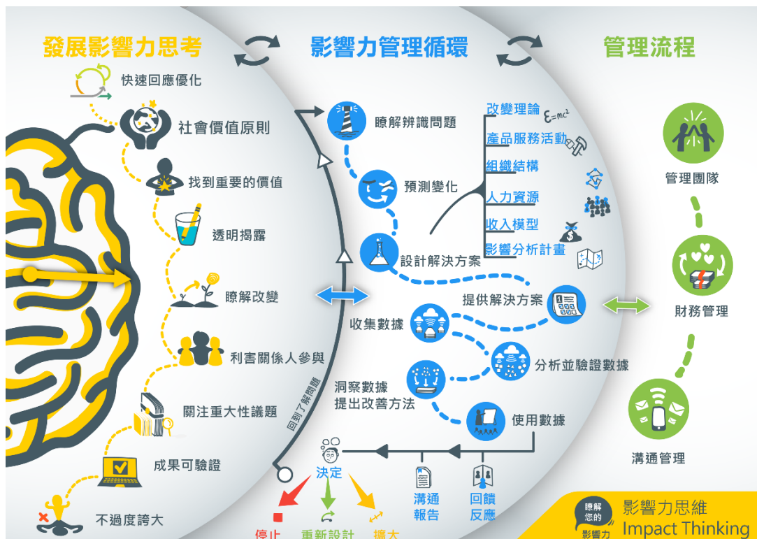
圖 影響力思維與管理概念圖

因此，國立臺中教育大學管理學院社會企業中心(以下簡稱本中心)為落實永續發展目標，因應產業時代潮流需求，扶植永續創業及社會創新提案團隊，提出「Maximize Your Impact - 影響力生態圈徵集計畫」，一方面鎖定社會企業、新創團隊及非營利組織之公益或社會創新專案，導入影響力衡量與管理 (Impact Measurement & Management, IMM) 思維(圖 1)，促使團隊在整體資源的配置及應用上，能夠精準對焦企業 ESG 或善盡社會責任之公益需求，另外一方面，透過專業及透明之影響力展現，創造企業在邁向永續轉型及公益推動，能夠有效責信及管理，以建立台灣影響力團隊共好生態圈。